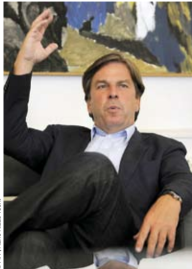
Landeshauptmann Franz Voves meidet in Wahlkampfzeiten Private TV-Sender.

SPÖ & ÖVP bauen in der Steiermark auf den ORF – ATV lässt man links liegen.